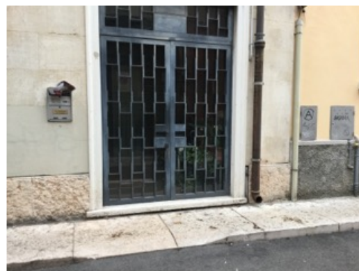
Foto del rilievo

Dislivello causato da gradino di 2/30 cm